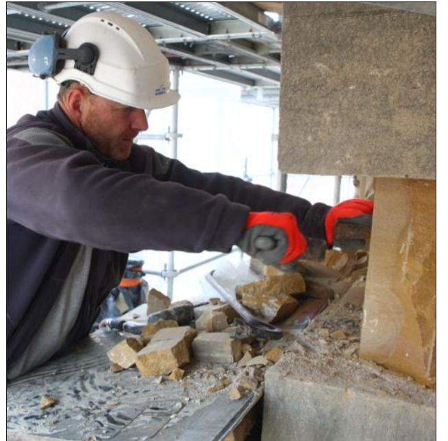
Les travaux en cours à la collégiale de Thann sur le portail Nord seront présentés le 1 er décembre.

La Fondation pour la sauvegarde de la collégiale fête ses dix ans le samedi 1 er décembre à 16 h, à la collégiale (accueil du public à partir de 15 h 30).