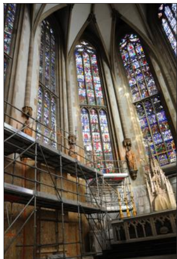
De hauts échafaudages sont indispensables pour rénover les vitraux.

SURFER Sur le site internet www.fondation-collegiale-thann.fr