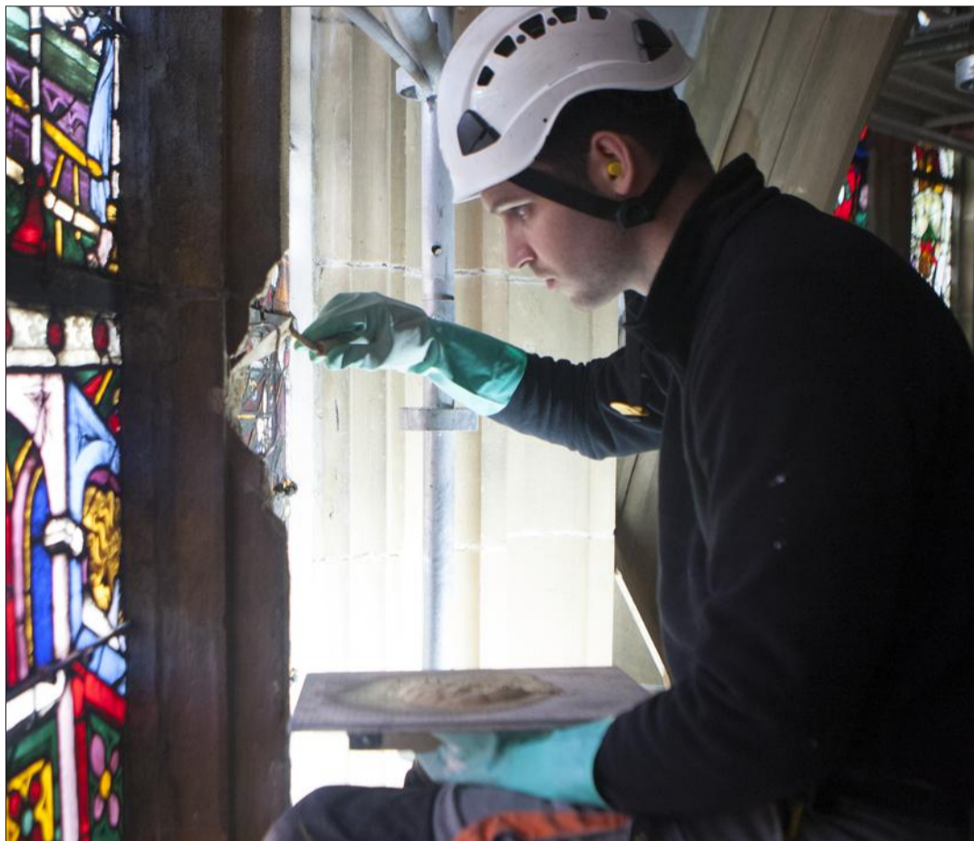
Les tailleurs de pierre sont à l'œuvre depuis le mois de janvier. Après avoir nettoyé toutes les pierres de l'édifice, ils sont en train de les restaurer avec différents mortiers.

La surface de nombreuses pierres était également noircie par une couche de poussière et des dé-