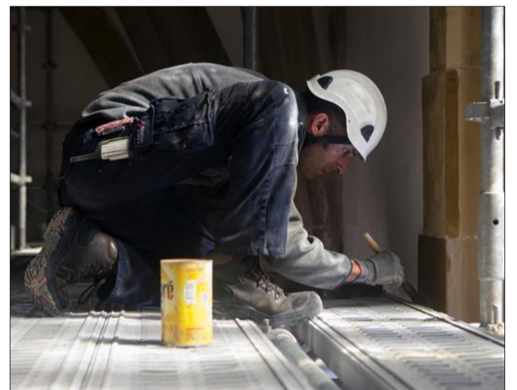
Pour finir, un badigeon d'eau-forte est appliqué sur toutes les pierres. Constitué de chaux, d'eau et de pigments naturels, il permet d'harmoniser la teinte des pierres.