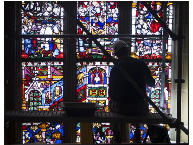
À la lumière des vitraux du chœur de la collégiale, assis sur un échafaudage à 20 m du sol, les tailleurs de pierre œuvrent au nettoyage et à la restauration de toutes les pierres de l'édifice.

SOUTENIR Pour soutenir la Fondation pour la sauvegarde de la collégiale qui est à l'initiative des travaux de restauration intérieure (coût total : quelque 700 000 €, dont 400 000 € sont financés par la fondation), il est possible de faire des dons. Informations sur : www.fondation-collégiale-thann.fr Adresse postale : 35, rue du Général de Gaulle - 68800 Thann.