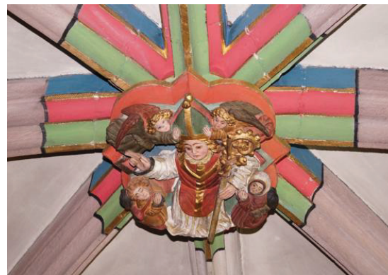
Une clef de voûte ornée de Saint-Thiébaud flanqué de deux pèlerins.